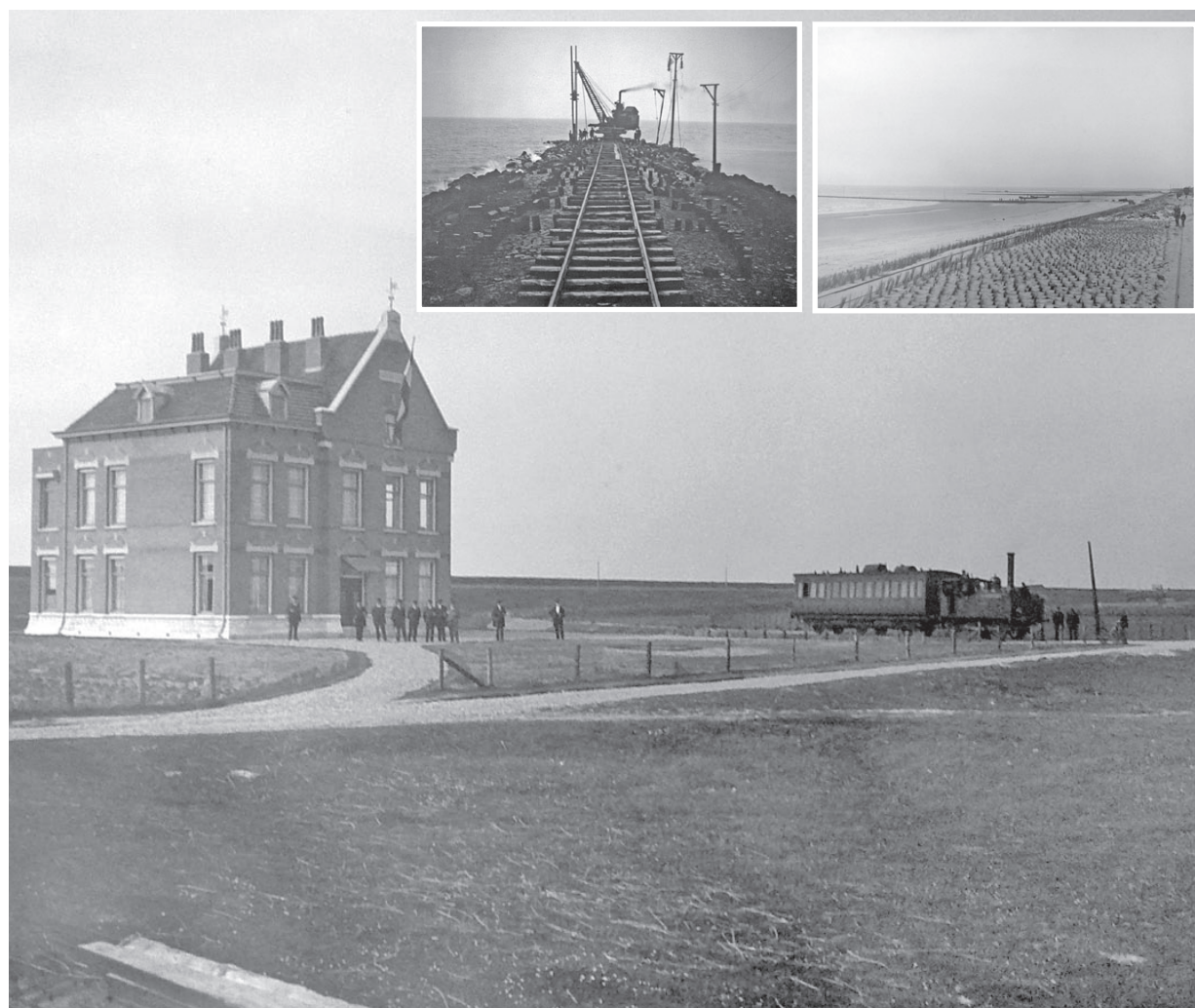
De strandlijn Hoek van Holland kende geen personenvervoer. Voor dit gezelschap voor het directiekantoor aan de losplaats bij 's-Gravenzande werd een uitzondering gemaakt. Het gebouw is tijdens de Tweede Wereldoorlog op last van de bezetter afgebroken.

Tijdens de Duitse bezetting kwam de verbinding goed van pas voor de aanleg van de Atlantic Wall, die had moeten verhinderen dat de geallieerde troepen hier aan land zouden gaan. De spoorlijn voerde toen grind en zand aan voor het maken van beton voor de bunkerbouw. Na de bevrijding is het lijntje geleidelijk aan verdwenen. Alleen in Hoek van Holland bleven enkele honderden meters in gebruik voor de aanvoer van materiaal voor de versterking van het toch wel smalle duingebied tussen die plaats en Ter Heijde. Uiteindelijk bleven slechts 14,8 meter over, die slecht werden onderhouden, terwijl de NS graag van deze bedrijfsvreemde verbinding af wilde. In 1971 werd het boek 'strandlijn' dan ook definitief gesloten en verdween met de aansluiting